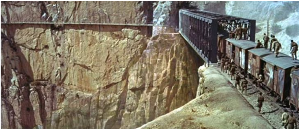
Von Ryan's Express aan de Desfiladero de los Gaitanos

verdwijnen, denk er dan aan dat dit de spectaculaire setting was voor de oorlogsfilm 'Von Ryan's Express' uit 1965, met Frank Sinatra als onverschrokken oorlogspiloot.