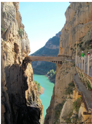
de hangbrug naderend

- De twee rotswanden worden op hun nauwste punt –slechts 10 meter- verbonden door een hangbrug. Deze prijkt op de meeste foto's en is zo 'n beetje hét embleem van de streek. Het is de laatste en meest spectaculaire etappe van het wandelpad. Dat is de natuurlijke habitat van wilde berggeiten en vale gieren, dieren zonder hoogtevrees, maar de gemiddelde mens haalt best even diep adem voordat hij de lichtjes bewegende hangbrug betreedt, zeker als het waait.