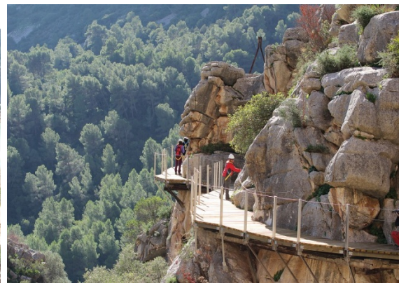
De nieuwe Camino (vanaf 2015)

- Met toegangswegen is de wandeling 7,7 km lang. Het meest spectaculaire deel - van passerelle tot passerelle - is 2,9 km. Reken op 3 à 4 uur voor het hele traject. Neem rustig de tijd want de natuur is adembenemend mooi.