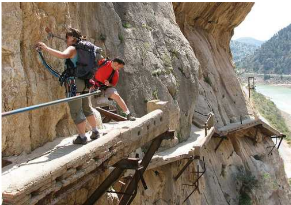
De oude Camino (tot 2010)

- Het wandelpadje kreeg zijn naam nadat koning Alfonso XIII het pad in 1921 bij wijze van inhuldiging afwandelde, om in het midden van het bruggetje de ingenieur van het project te begroeten. De provincie Málaga vroeg Alfonso's achterkleinzoon, de huidige koning Felipe, om de gerestaureerde Camino del Rey te komen inhuldigen, maar die stuurde zijn kat. De gewone Spanjaard liet het alvast niet aan zijn hart komen: de eerste maand na de heropening trok het koningspad bijna 25.000 nieuwsgierigen op zoek naar spanning en avontuur.